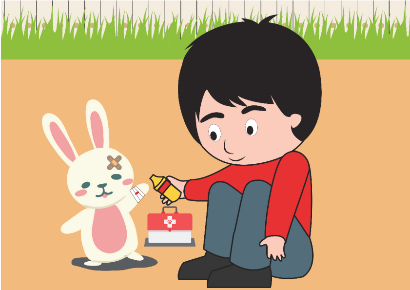
Gambar anak mengobati binatang peliharaan