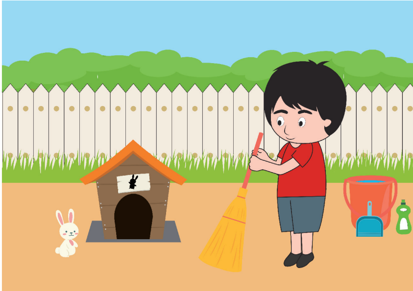
Gambar anak membersihkan kandang