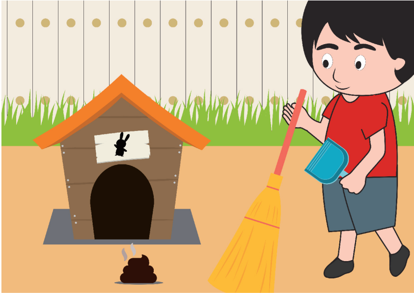
Gambar anak membersihkan kotoran binatang