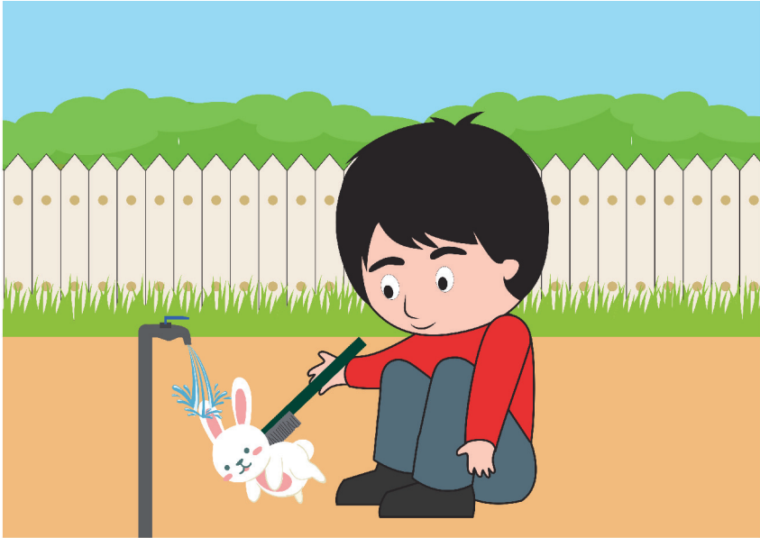
Gambar anak membersihkan binatang peliharaan