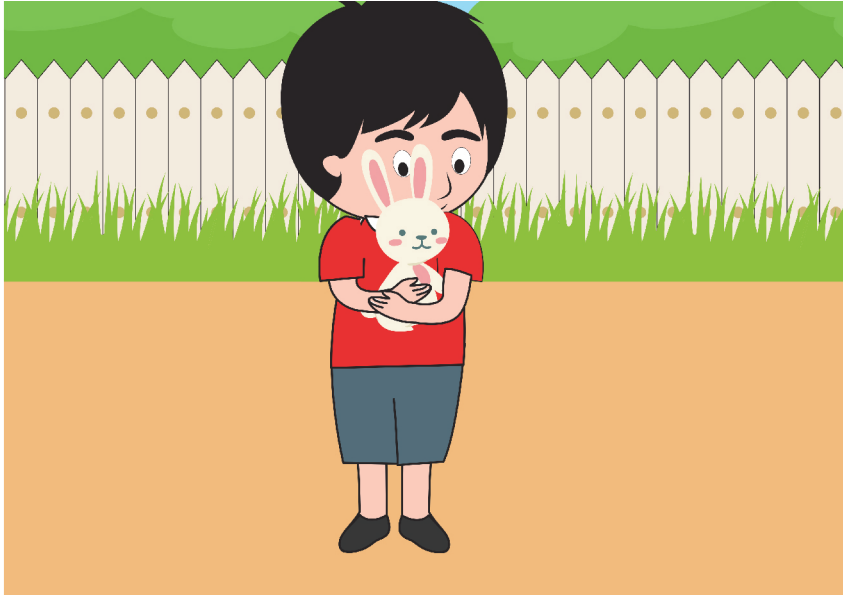
Gambar anak menggendong /menyayangi binatang peliharaan