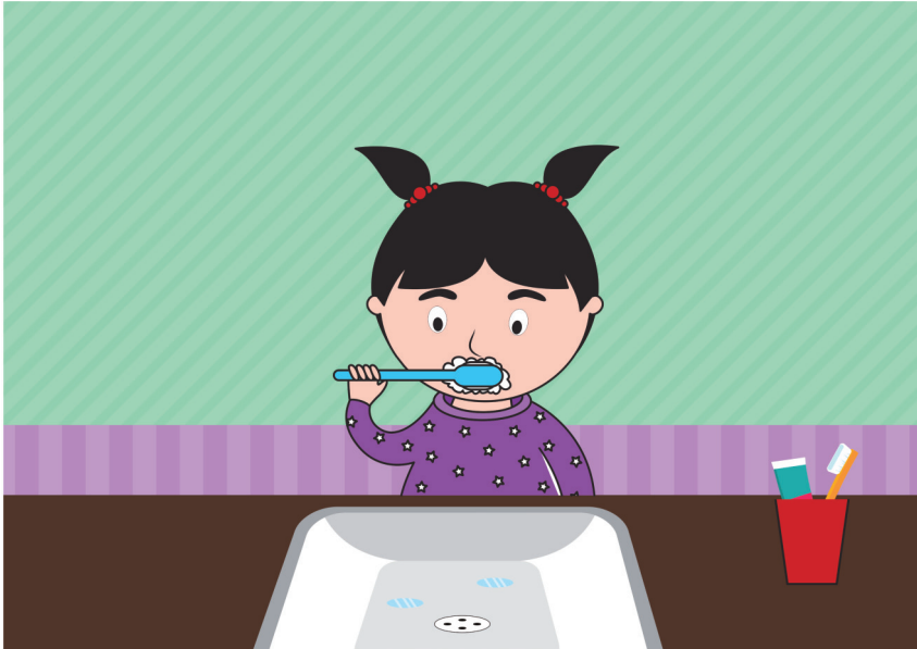
Gambar menggosok gigi depan