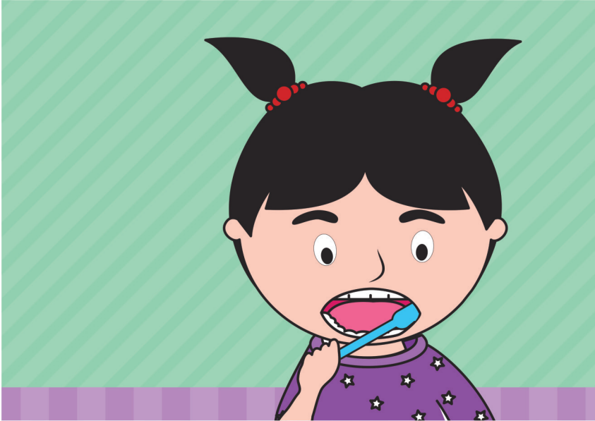
Gambar menggosok gigi sampai celah gigi