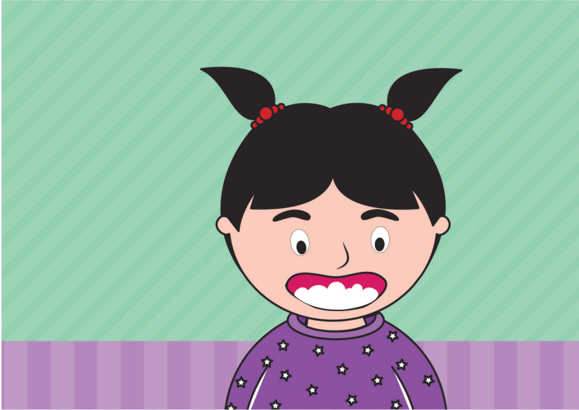
Gambar berkumur setelah menggosok gigi