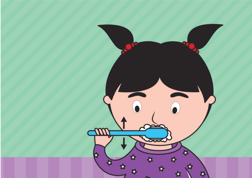
Gambar menggosok gigi gerakan atas bawah