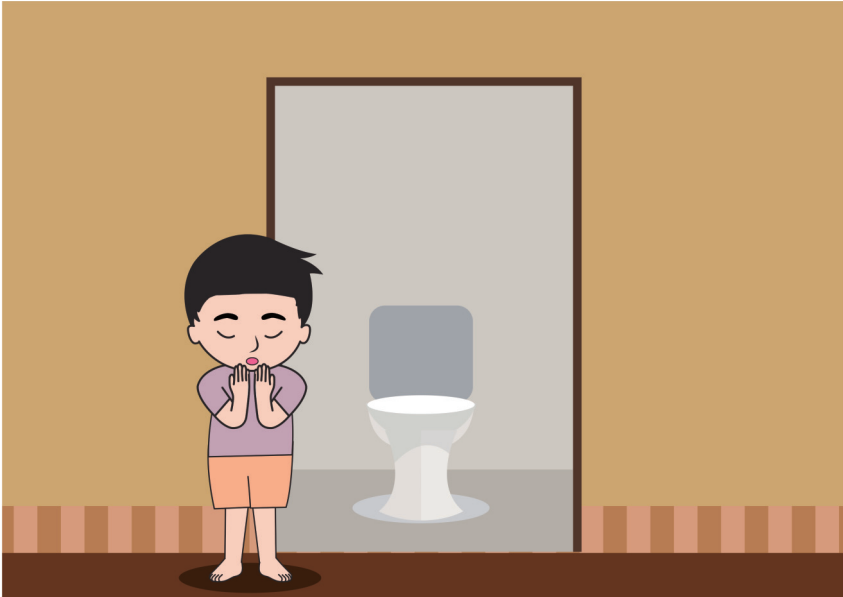
gambar anak yang sedang berdoa setelah keluar dari jamban