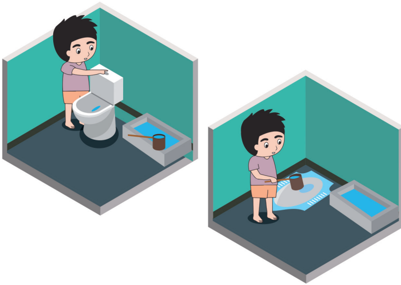
Gambar anak sedang menyiram jamban duduk dan jamban jongkok