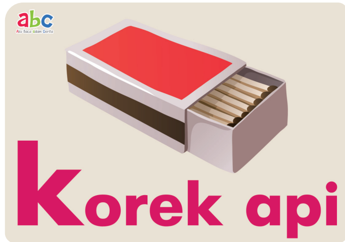
Gambar Kartu Huruf "K"